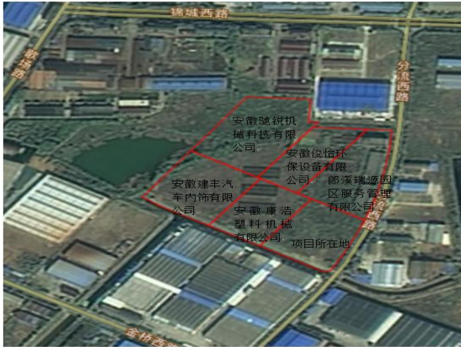
图 1.3-1 项目区位置与周边关系图