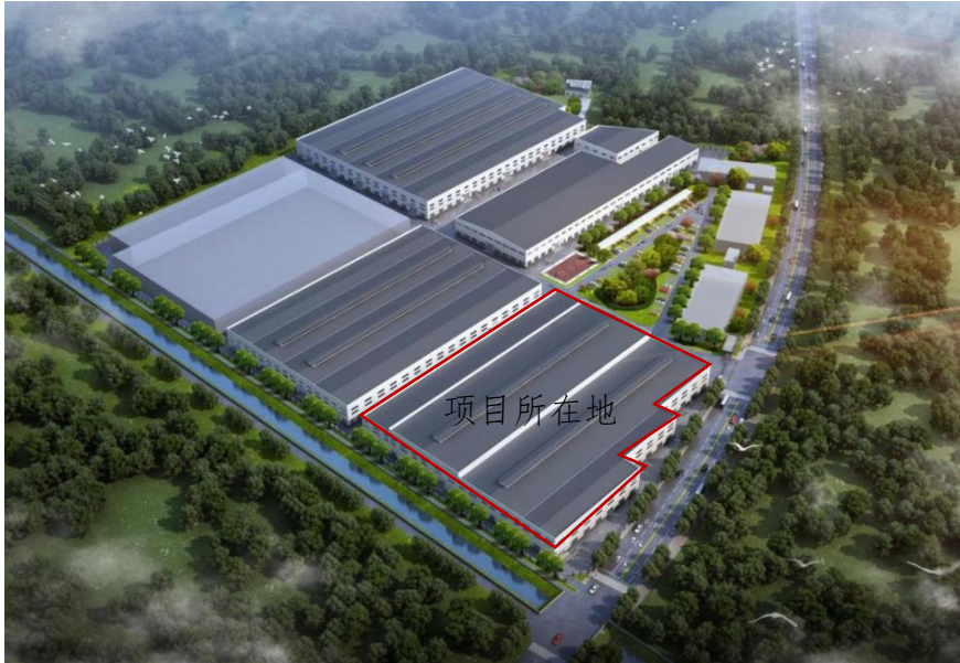
1.5-1 项目建成后效果图